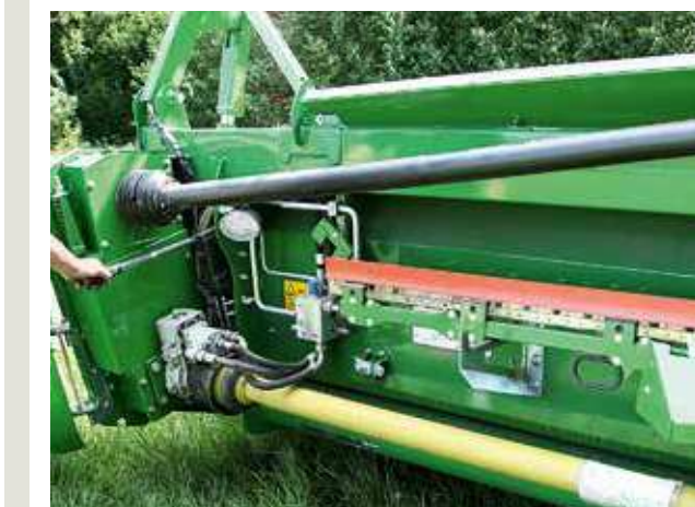
Das Umrüsten auf Raps dauern nur wenige Minuten: Die Schnecke wird einfach hochgepumpt und das Messer hinten aus der Halterung genommen...