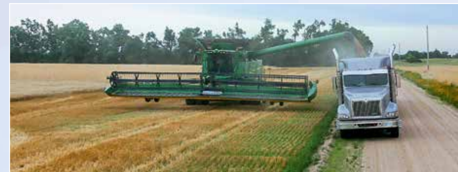
In den USA wird das Getreide fast immer mit Lkw abtransportiert.

26-t-Getreide-Aufliegern. Außerdem gibt es noch Tieflader, um die schweren Erntegeräte von einem Einsatzort zum nächsten zu bringen. Auf den Maschinen gibt es keine festen Fahrer. Jeder darf alles fahren, aber Wünsche und Vorlieben werden natürlich berücksichtigt. Katja fährt meistens einen Lkw oder den T670 mit PremiumFlow-Schneidwerk. „An manchen Tagen starten wir um 10 Uhr mit dem Dreschen und fahren dann bis etwa 24 Uhr. Hier in North Dakota taut es aber meis-