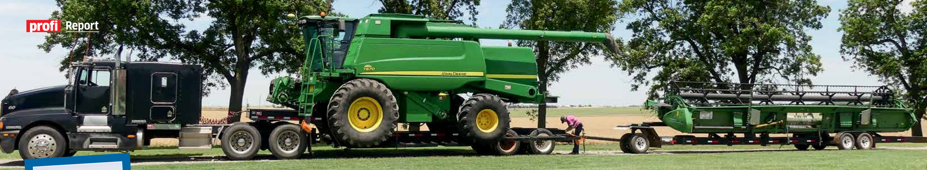
In den USA sind die Entfernungen für die Drescher auf eigener Achse nicht zu schaffen.