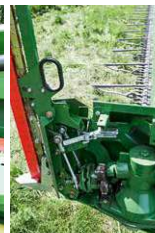
...und dann vorne statt Halmteiler eingerastet! Der Antrieb erfolgt mechanisch – genial!