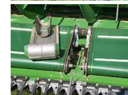
Man muss nur zwei Schrauben der Abdeckungen lösen, schon kann man die Bandlelemente hochschwelen. Dank automatischer Spanner sind sie aber komplett wartungsfrei.

der Antriebskette gelöst werden. Die Montage der – ebenfalls an der Schneidwerkrückwand geparkten – Seitenmesser erfordert zwar ein beherzteres Zupacken, aber auch nicht mehr Zeit.