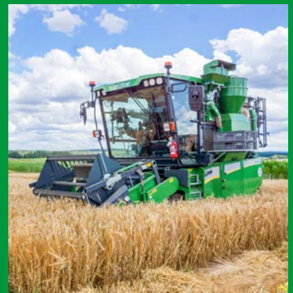
FELDVERSUCHSTECHNIK FÜR DIE PFLANZENZÜCHTUNG