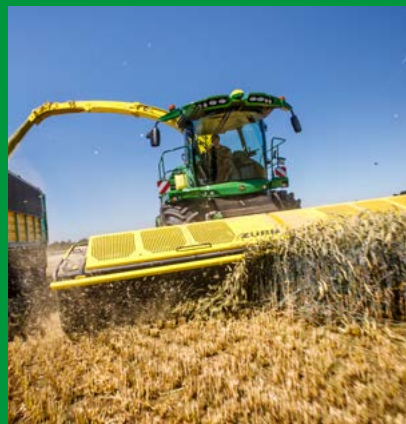
SCHNEIDWERKE FÜR FELDHÄCKSLER