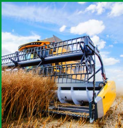
SCHNEIDWERKE FÜR MÄHDRESCHER

Wir sind verwurzelt in der Landwirtschaft und auf den Feldern der Welt zu Hause. Das Unternehmen ZÜRN wurde 1885 als Schmiede gegründet. Bis heute steht ZÜRN für 100% Made in Germany.